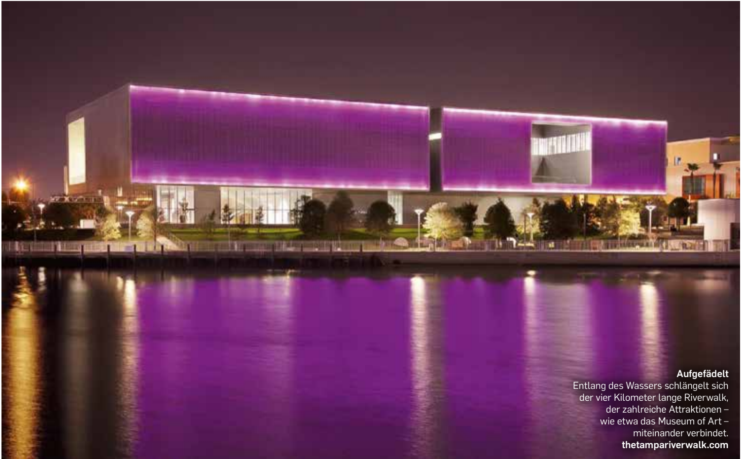
Aufgefädelt Entlang des Wassers schlängelt sich der vier Kilometer lange Riverwalk, der zahlreiche Attraktionen – wie etwa das Museum of Art – miteinander verbindet. thetampariverwalk.com

> Nicht nur in Downtown verändert sich die Tampa Bay. In der ganzen Stadt bilden sich neue Neighborhoods. Hydepark ist etwa ein Viertel, das aus lauter Millionen-Dollar-teuren Südstaaten-Villen besteht, gesäumt von uralten Bäumen, an denen das Spanische Moos wie mystische Lampions baumelt. Allerdings hatte diese Gegend nie ein Zentrum. WS Development aus Boston erkannte das, kaufte sieben schäbige und ganz und gar nicht in das Quartier passende industrielle Gebäude auf und entwickelte ein Bilderbuch-Dorfzentrum mit einem entzückenden Platz, Bänken, Brunnen, gepflegten Shops, hippen Restaurants sowie dem Hyde House, eine fast 3.000 Quadratmeter große, servierte Co-Working-Fläche mit hohem Design-Anspruch. »Das ist jetzt eine beliebte Gegend, sie löst Indoor-Malls ab. Die Leute wollen nicht mehr Auto fahren. Live, Work, Play an einem Ort«, erzählt eine Passantin.