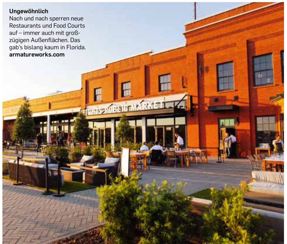
Ungewöhnlich Nach und nach sperren neue Restaurants und Food Courts auf – immer auch mit großzügigen Außenflächen. Das gab's bislang kaum in Florida. armatureworks.com

Weitere Baustellen der Stadt: 45 Millionen US-Dollar werden in das Areal beim (sehenswerten!) Aquarium gesteckt. Auch dort, wo das historische Zentrum der Stadt liegt, >