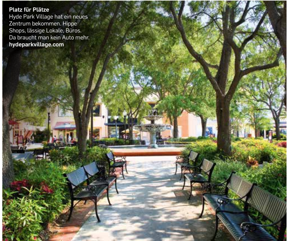
Platz für Plätze Hyde Park Village hat ein neues Zentrum bekommen. Hippe Shops, lässige Lokale, Büros. Da braucht man kein Auto mehr. hydeparkvillage.com

Tampa Bay wird gerade zur neuen Destination im Herzen Floridas. Dennoch ist es eine funktionalisierende Stadt, die weder Micky-Mouse-Orlando noch hysterisches Miami sein will. Sie will sich nicht verstellen. Zum Abschied wünscht einem Jane Castor im Flughafenzug durch die Lautsprecher eine gute Reise. Sie ist die Bürgermeisterin, bekennende Lesbin und mit einer Frau verheiratet. Das passt. <