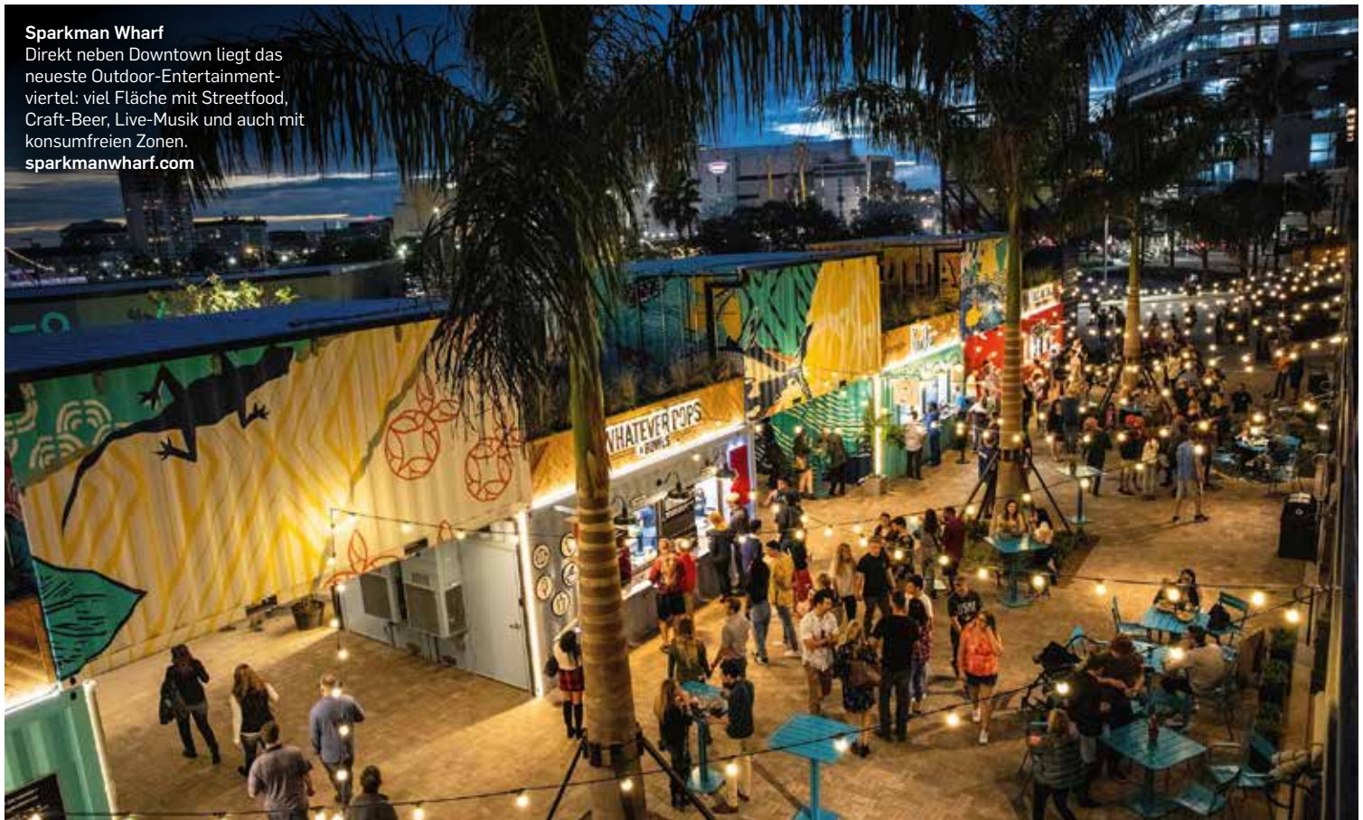
Sparkman Wharf Direkt neben Downtown liegt das neueste Outdoor-Entertainmentviertel: viel Fläche mit Streetfood, Craft-Beer, Live-Musik und auch mit konsumfreien Zonen. sparkmanwharf.com